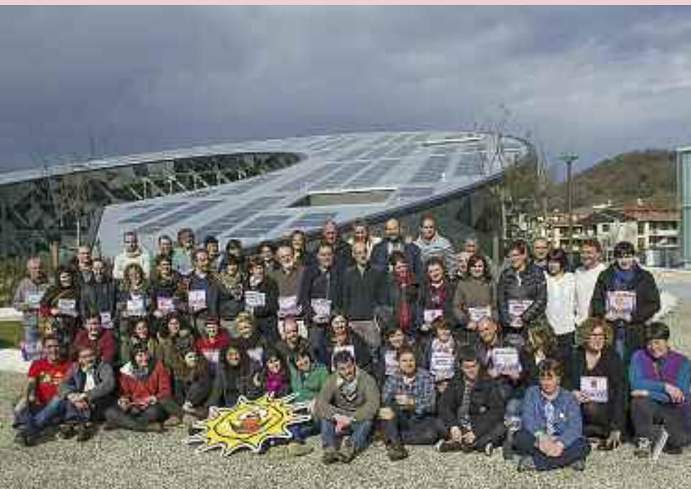
Hernaniko Orona fundazioaren egoitzan hainbat eskola, udal eta eragile Irrizale izateagatik omendu zituzten.